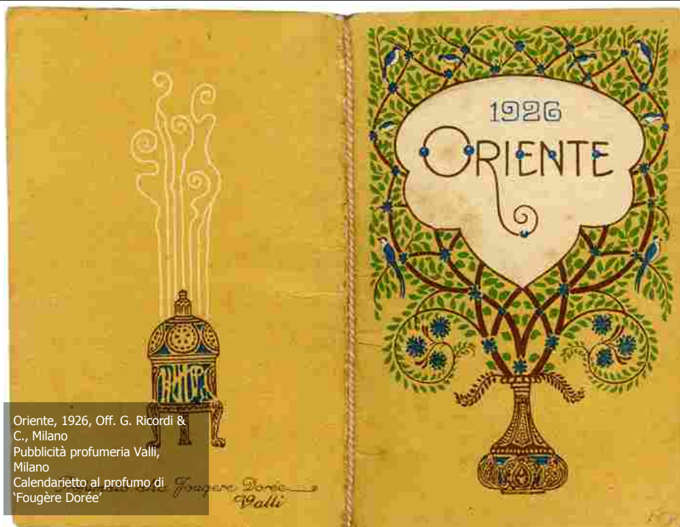
Oriente, 1926, Off. G. Ricordi & C., Milano Pubblicità profumeria Valli, Milano Calendarietto al profumo di 'Fougère Dorée'