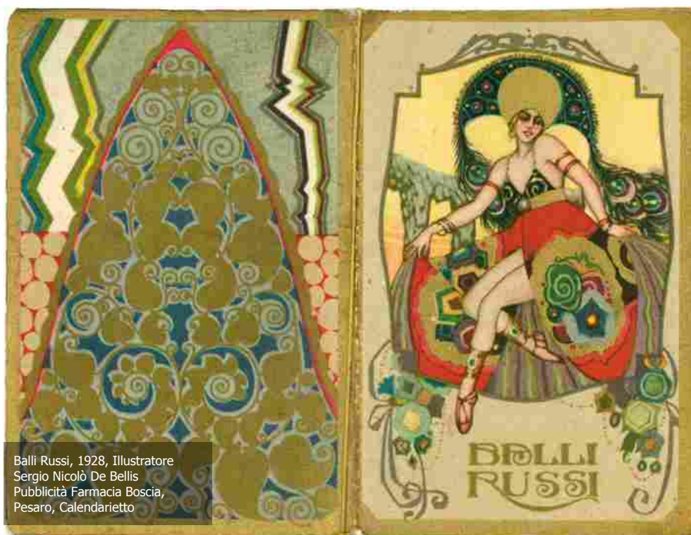
Balli Russi, 1928, Illustratore Sergio Nicolò De Bellis Pubblicità Farmacia Boscia, Pesaro, Calendarietto

Accompagna la mostra il catalogo L'arte in tasca. Calendarietti, réclame e grafica 1920-1940 (Franco Cosimo Panini) con testi del curatore Giacomo Lanzilotta e di Maurizio De Paoli . Accanto un ampio repertorio iconografico di circa 300 immagini, i testi di Giacomo Lanzilotta mettono in luce per la prima volta in maniera completa e sistematica le biografie di artisti noti e meno noti che hanno lavorato nella micrografica. Maurizio De Paolo si concentra invece su un'analisi storica approfondita di questa particolare forma d'arte.