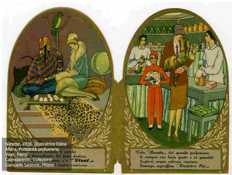
Nanette, 1928, Illustratrice Edina Altara, Pubblicità profumeria Viset, Parigi Calendarietto, Collezione Giancarlo Saccone, Milano

Tota "Nanette" dal grande profumiere. E compra con buon gusto e in quantità. Cozzoni, acque colonia, saponi. Essenza soprastina "Première Fol".